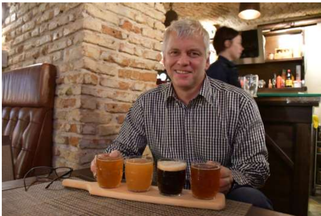
Viesturs Tamužs, Президент Латвийской Федерации ориентирования

Добро пожаловать к нам летом 2019 года! Прекрасное времяпровождение гарантировано!